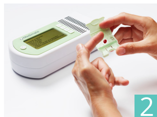
2 aanbrengen druppel op lab-chip