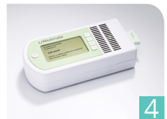
4 resultaat wordt getoond op het scherm van de meter