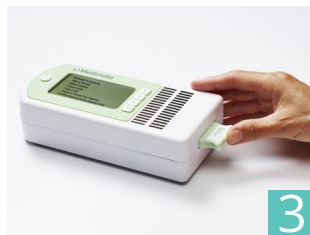
3 plaatsen van lab-chip in meter