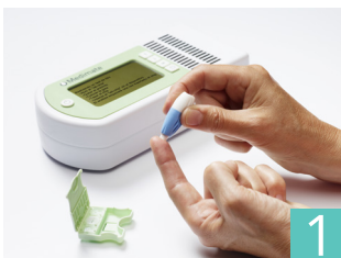
1 zetten vingerprik

Met het Medimate MiniLab kan in enkele minuten eenvoudig de lithiumspiegel bepaald worden. Het MiniLab is zeer gebruiksvriendelijk, functioneel en betrouwbaar. Zo is het niet meer nodig om een buisje bloed af te nemen: slechts één druppel bloed uit de vingertop volstaat om binnen enkele minuten het lithium gehalte te weten. Een meting ziet er als volgt uit: